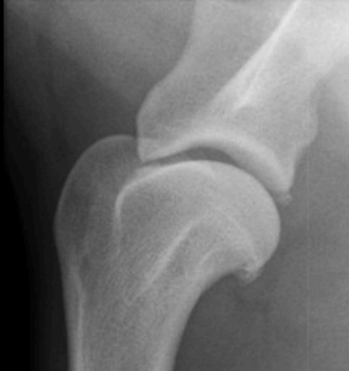
Osteoartrose uden tegn på OCD